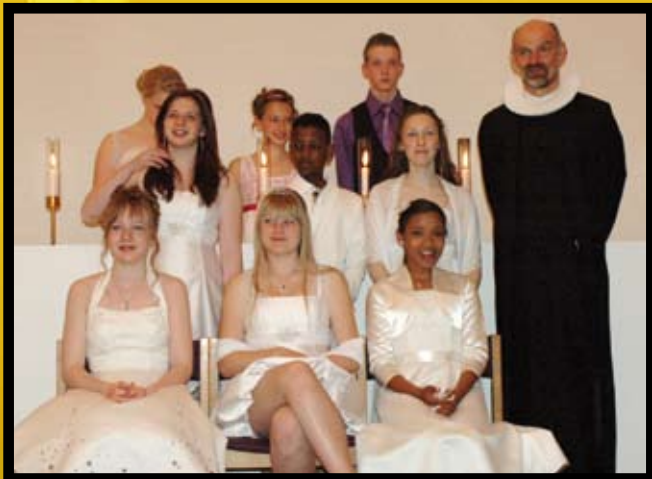
Store bededag den 30. april