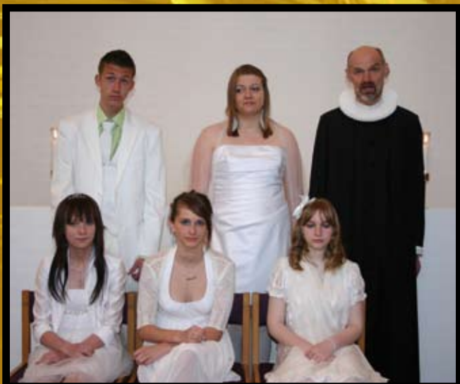
Søndag den 2. maj