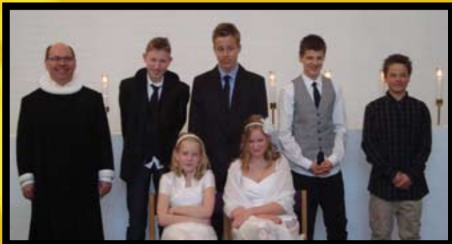
Søndag den 25. april