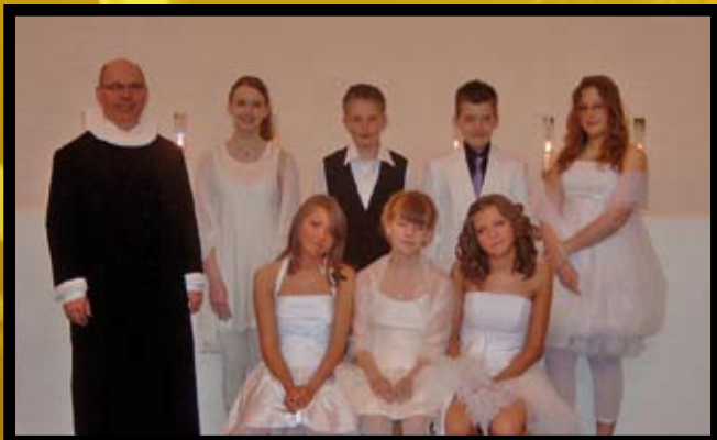
Store bededag den 30. april